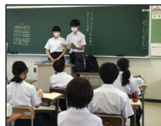
合唱コンクール選曲委員会