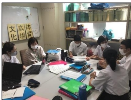
生徒会執行部の話し合い