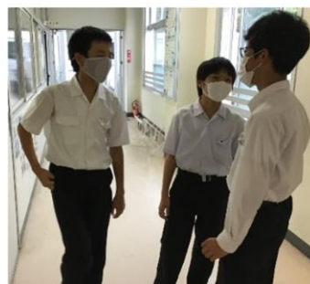
登校後の朝の様子 (左から1年生、2年生、3年生)