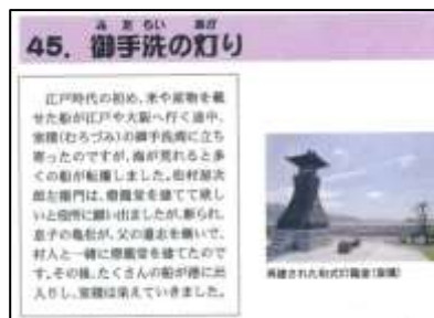
←光ライオンズクラブ 「光ふるさとカルタ」より

また、ペタンクについては、あまり馴染みのない競技かもしれませんが、1907年にフランスで生まれた球技で、名称は南フランス・プロヴァンスの方言「ピエ・タンケ(両足を揃えて)」に由来するそうです。カーリングに似ていて、コート上に描いたサークルを基点として、目標球に金属製のボールを投げ合って、相手より近づけることで得点を競うスポーツです。ドッチボールやバスケットボールなどで、クラスマッチを行うことも良いのですが、普段あまりしたことのない種目を経験することも、大切な学びだと思います。今回の交流会を通して、また一段と学年の輪が広がると良いなと思いました。